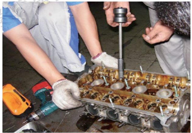
图2 气门油封的拆卸